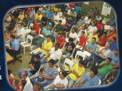
1º workshop para aplicadores

Para conscientizar os aplicadores sobre o uso correto de peças automotivas, a Tampas Click realizará durante todo o ano, workshops para aplicadores (mecânicos). Nos meses de fevereiro e março foram realizados dois eventos. Dia 20 de fevereiro, que contou com a presença de 130 participantes e 18 de março, em que 50 aplicadores tiveram a oportunidade de visitar a fábrica.