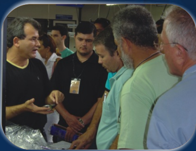
Aplicadores conhecem o processo de produção da Click

cuidados com a qualidade do líquido de arrefecimento; funcionamento das tampas de radiadores, expansão e compensação; funcionamento básico do sistema de abastecimento de combustível.