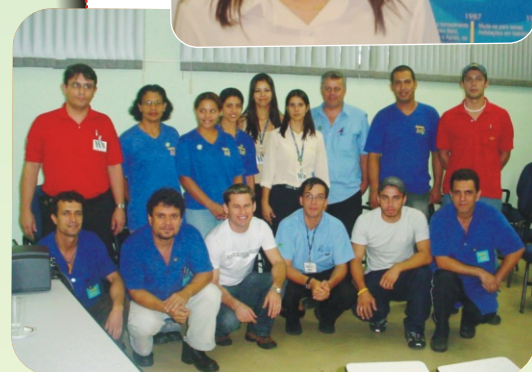
Comissão CIPA 2006/2007